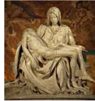
La piedad. Miguel Ángel