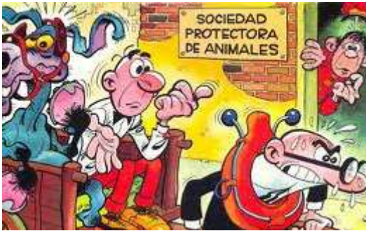
Vinyeta de Mortadelo y Filemón. Francisco Ibáñez.