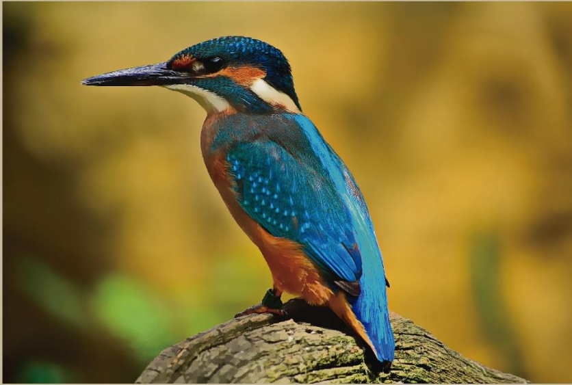
Martí pescador comú (Alcedo atthis) Martí pescador comú (Alcedo atthis)