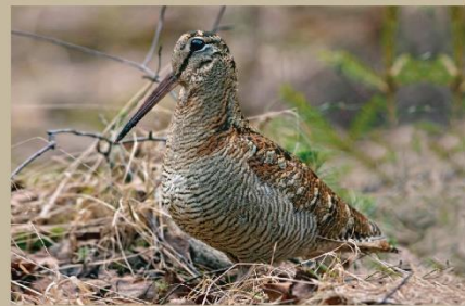
Becada (Scolopax rusticola) Becada (Scolopax rusticola)

Becada (Scolopax rusticola) Mide unos 35 cm. Suele ser difícil de ver debido a su plumaje de color pardo con ocres y negros que la camufla perfectamente al medio. Suele estar activa en las horas crepusculares, alimentándose en las orillas del pantano. Come insectos, babosas, miriápodos y caracoles que captura hundiendo su largo pico en el barro.