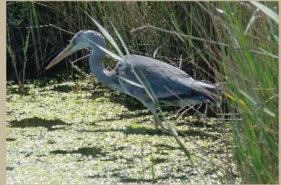
Garsa reial (Ardea cinerea) Garsa reial (Ardea cinerea)