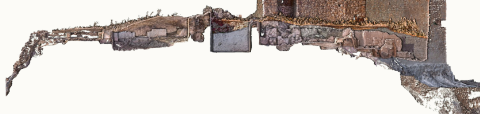
▲ Plànol i secció del conjunt arqueològic. Elaborat a partir de Ulloa, P., Masip, M. i Masip, A. / Plano y sección del conjunto arqueológico. Elaborado a partir de Ulloa, P., Masip, M. i Masip, A.