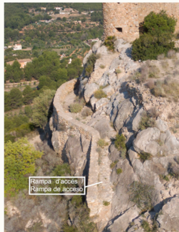
Rampa d'accés / Rampa de acceso