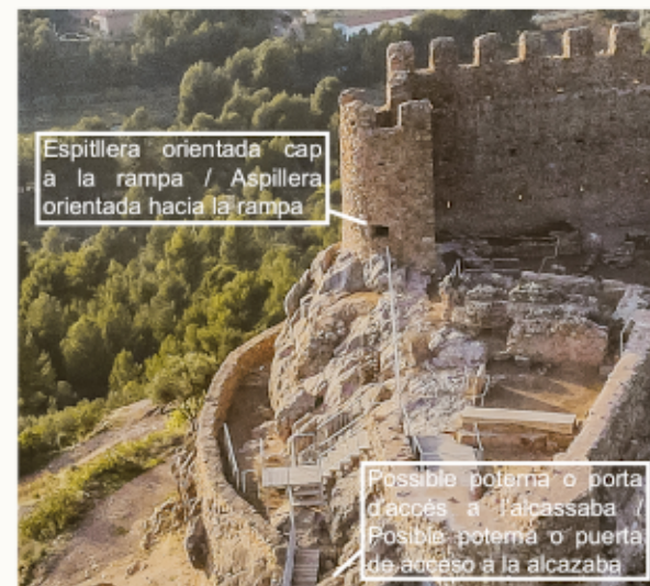
▲ Espitllera de la bestorre sud orientada cap a la rampa, per a defensa de l'accés a l'alcaçsaba / Espitllera de la bestorre sur orientada hacia la rampa, para defensa del acceso a la alcaçsaba