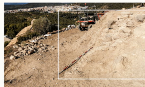
▼ Estructura localitzada a l'excavació arqueològica de 2021-2022, relacionada amb l'accés a l'alcaçsaba / Estructura localizada en la excavación arqueológica de 2021-2022, relacionada con el acceso a la alcaçsaba.