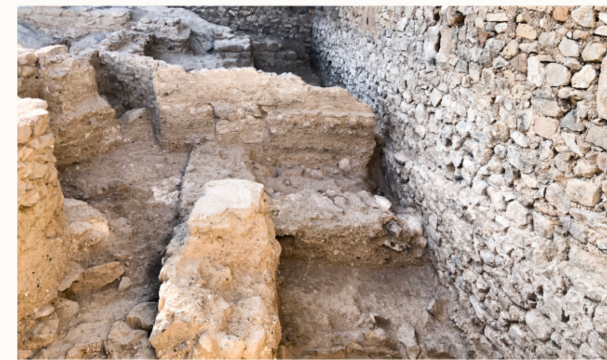
▲ Superposició d'estructures descobertes durant el procés d'excavació arqueològica (2022). / Superposición de estructuras descubiertas durante el proceso de excavación arqueológica (2022).