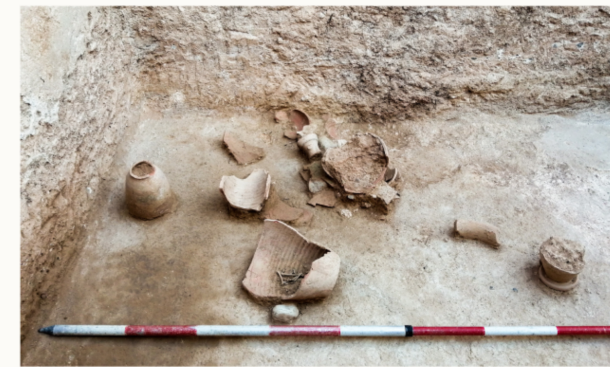
▲ Troballes al fons de l'aljub durant el procés d'excavació / Hallazgos en el fondo del aljibe durante el proceso de excavación