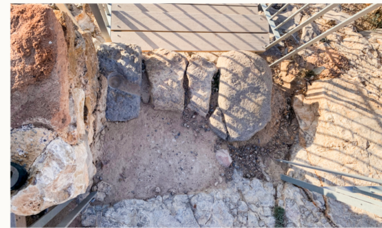
▲ Accés a l'alcassaba: brancal de pedra i polleguera per a l'encaix del piu o eix de la porta / Acceso a la alcazaba: umbral de piedra y quicio para el encaje del eje o espiga de la puerta